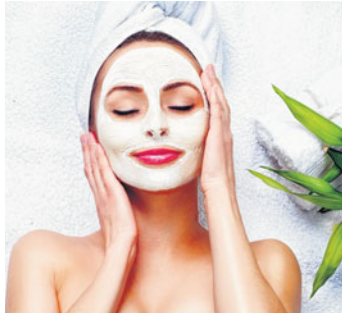
A méz hidratálja a bőrt és egyben tisztítja is, a tojás pedig kiváló bőrfeszítő.

Negyedóra elteltével hideg vízzel mossuk meg az arcunkat, és gyengéden szárogassuk meg.