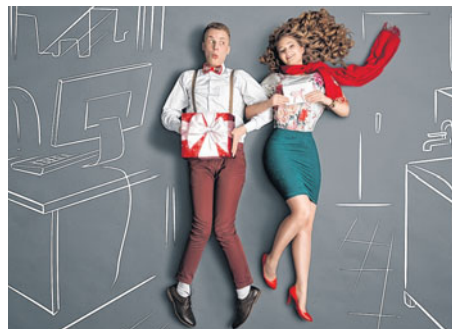
Ha kialakul szerelmi viszony a munkahelyen, a párok gyakran titkolják a főnökök vagy kollégák vélt vagy valós rosszallása miatt.